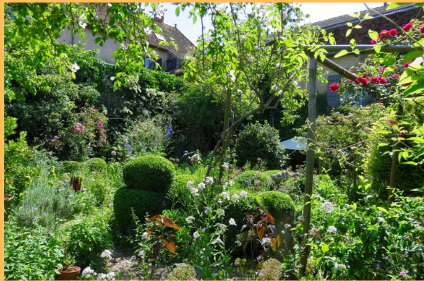
Jardin de la Fontaine 72 route de Mochère (Bourg)

Et aussi : A partir de 14h, cour de la Médiagora dans le bourg : vente de boissons et crêpes au profit de la rénovation de la chapelle du Petit Bois.