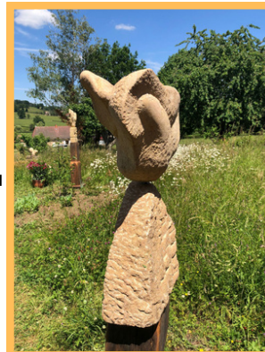
Le Jardin de sculptures 107 route d'Amanzé entrée libre