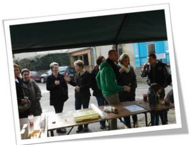
Vente de sapins et brioches

Des plats à emporter : vendredi 6 février et vendredi 3 avril 2015.