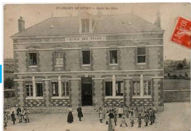
Début du siècle dernier

Dans le cadre des arts visuels et danse les 4 classes du RPI participeront en 2015 à un projet départemental liant différentes pratiques artistiques (dessin, danse, musique, ...)